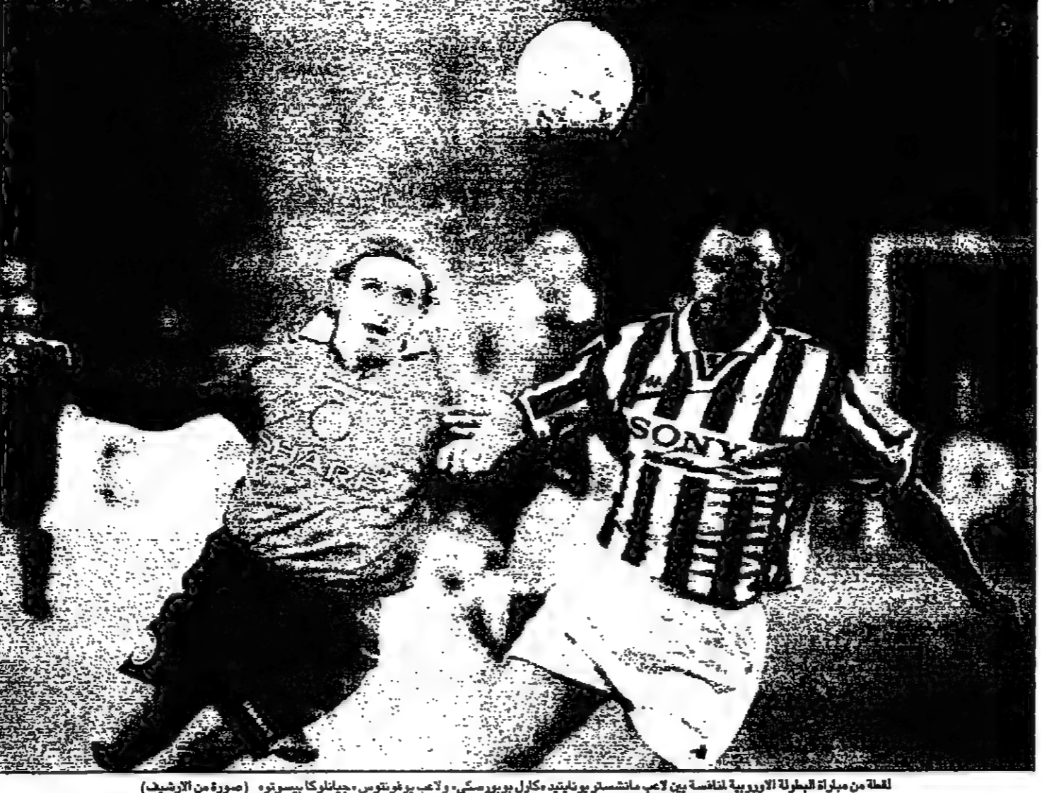
لغلة من مباراة البطولة الأوروبية لخاسية بين لاعب مانشستر يونايتد «كلود بيريسكي» ولاعب يوفنتوس «جيانكارلو بيستور»